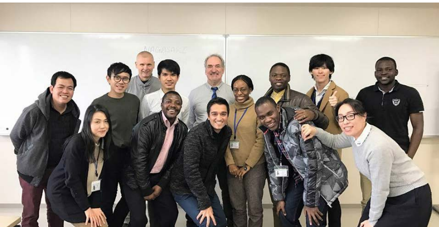
18か国を超える国々から55名の学生が国際保健の分野においてリーダーになるべく準備中