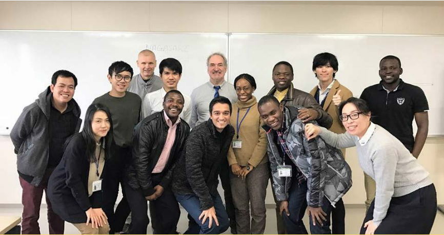
55 students from more than 18 countries are preparing to be leaders in global health

DIVERSITY: “Nationality matters in infection diseases control”