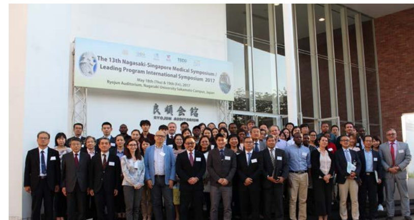
国際的な共同研究を振興： 長崎-シンガポールシンポジウム

“70年の感染症研究で培われた経験と実績でグローバルな視点を備えたリーダーを育成”