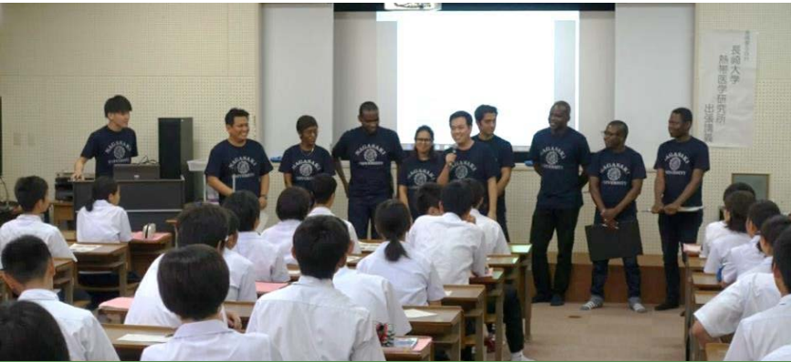
Harnessing the energy of young men and women to help promote the importance of global health = Future Global Leaders.

Nationality matters in the fight against infectious diseases: ❖ Students from different countries bring different perspectives regarding infectious diseases. For example: Students coming from Ebola, Dengue fever or Malaria endemic areas often have first hand knowledge of disease impact. ❖ Our tropical disease research institutions in Vietnam and Kenya allow us to get hands on training in infectious diseases control and management. ❖ Because infectious diseases knows no boundaries among countries, it is important to be able to work with others and have common understanding and goals.