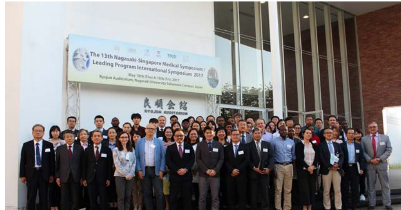
Promoting collaborative international research: Nagasaki-Singapore Symposium

Nagasaki University Leading Programs’ goal is to: “Train the next generation of global leaders in infectious diseases control on the basis of 70 years of experience in tropical diseases research”