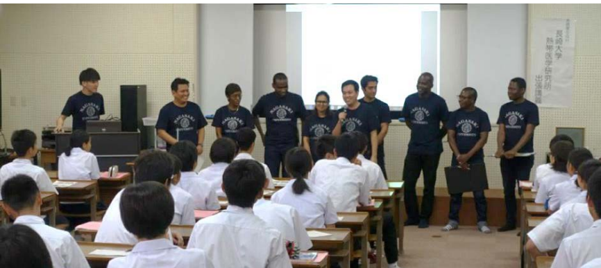
国際保健の重要性を促進させるため若い世代の力を掴む = 未来のグローバルリーダー