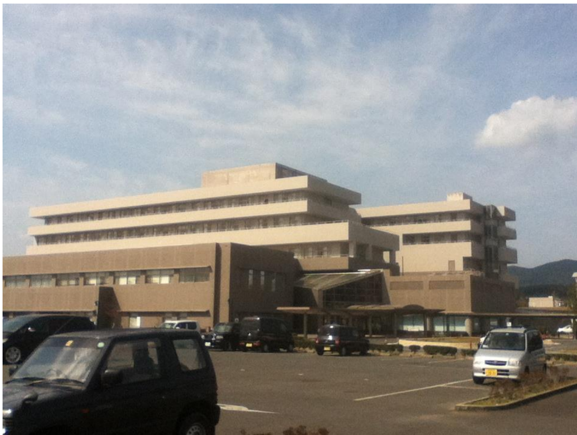
「五島中央病院外観」

五島は、山、海に囲まれた自然と、繁華街では多くの方々が生活をしている活気のある島でした。島中に教会が何個もありキリスト教群世界遺産にしようという運動がなされていました。離島実習では、五島中央病院、富江病院、両病院内の入院患者の口腔ケア実施意外にも、五島中央病院では、内科、外科の先生方に普段大学病院では見ることがない処置等を見学させていただき、1 ヶ月間を有効に過ごせたと思います。