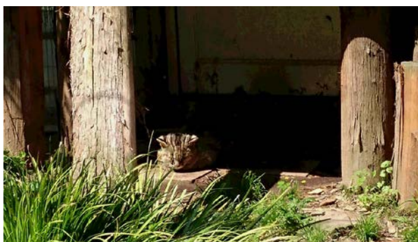
対馬野生動物保護センターでは、 ツシマヤマネコが飼育されていました。