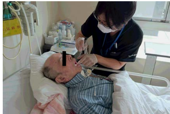
ベッドサイドでの口腔ケア

対馬はその地政学的特性から、古くから朝鮮半島に対する国防上の拠点として栄えた島であり、様々な歴史的遺産がありました。休日には対馬に残る遺跡のほか、自然を満喫させていただき、実習の本分とは外れますがこちらも楽しい思い出となりました。