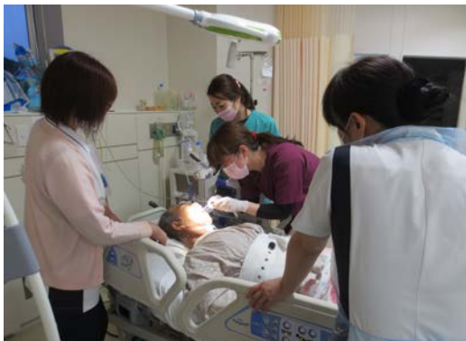
HCUにて。歯科の開業医の先生が 歯性感染症の患者さんの治療・ケアを 行われていました