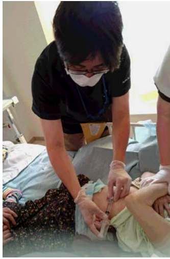
胃瘻のボタン交換