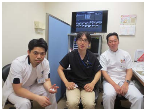
生理検査室の技師さんと。 超音波検査に関して 大変詳しく教えていただきました。